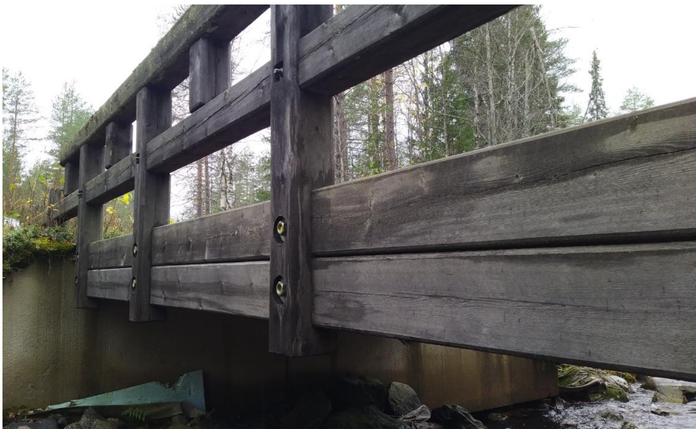
Kuva 7. Kaiteiden kiinnitys kansielementtiin