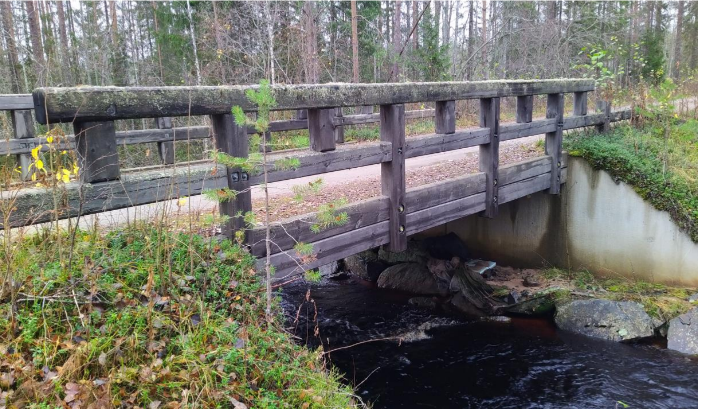
Kuva 5. Kaiderakenne ja liitokset