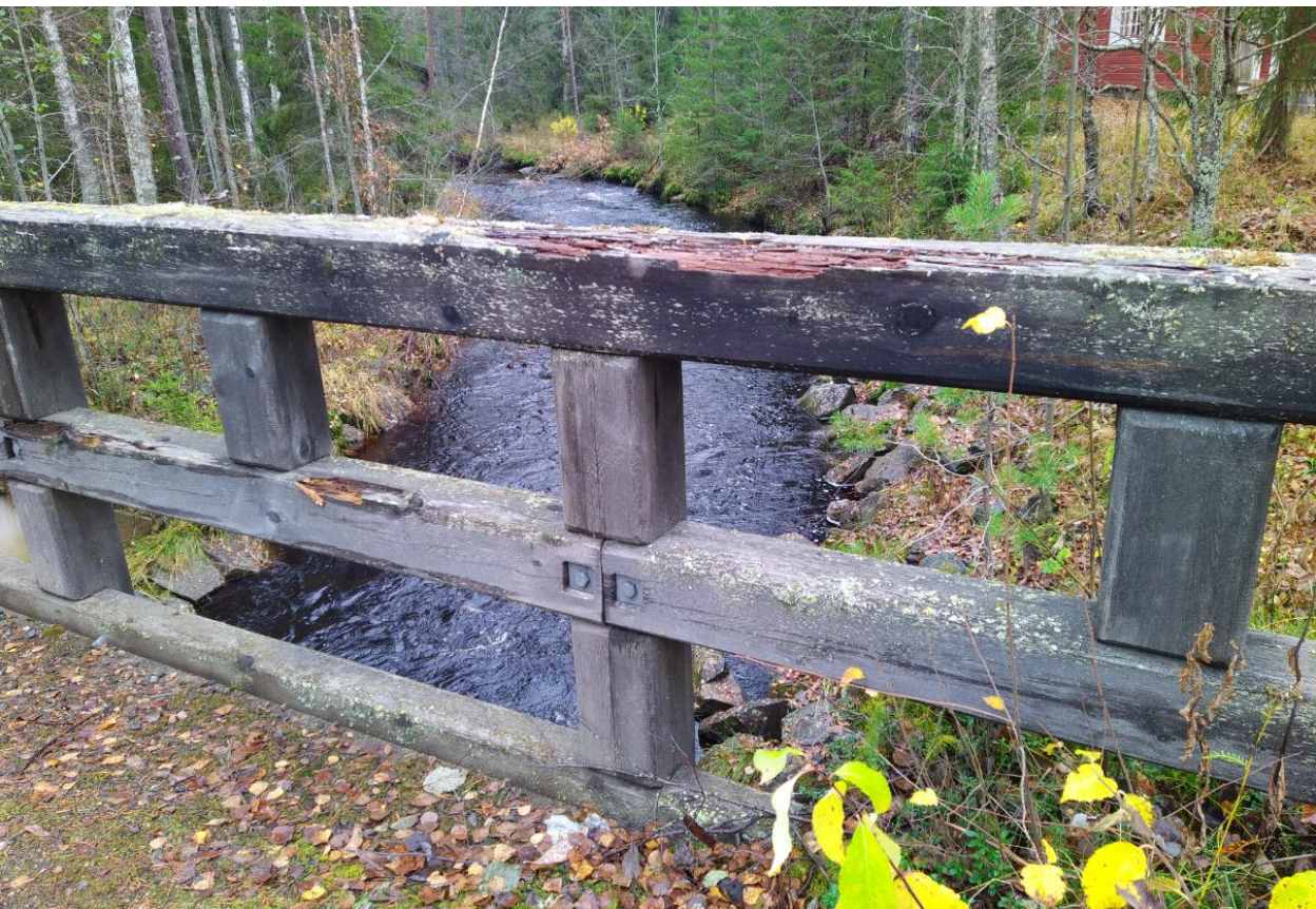
Kuva 6. Kaiderakenne ja siinä esiintyviä lahovaurioita