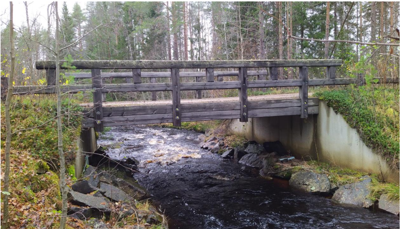
Kuva 4. Sivukuva sillankaiteista