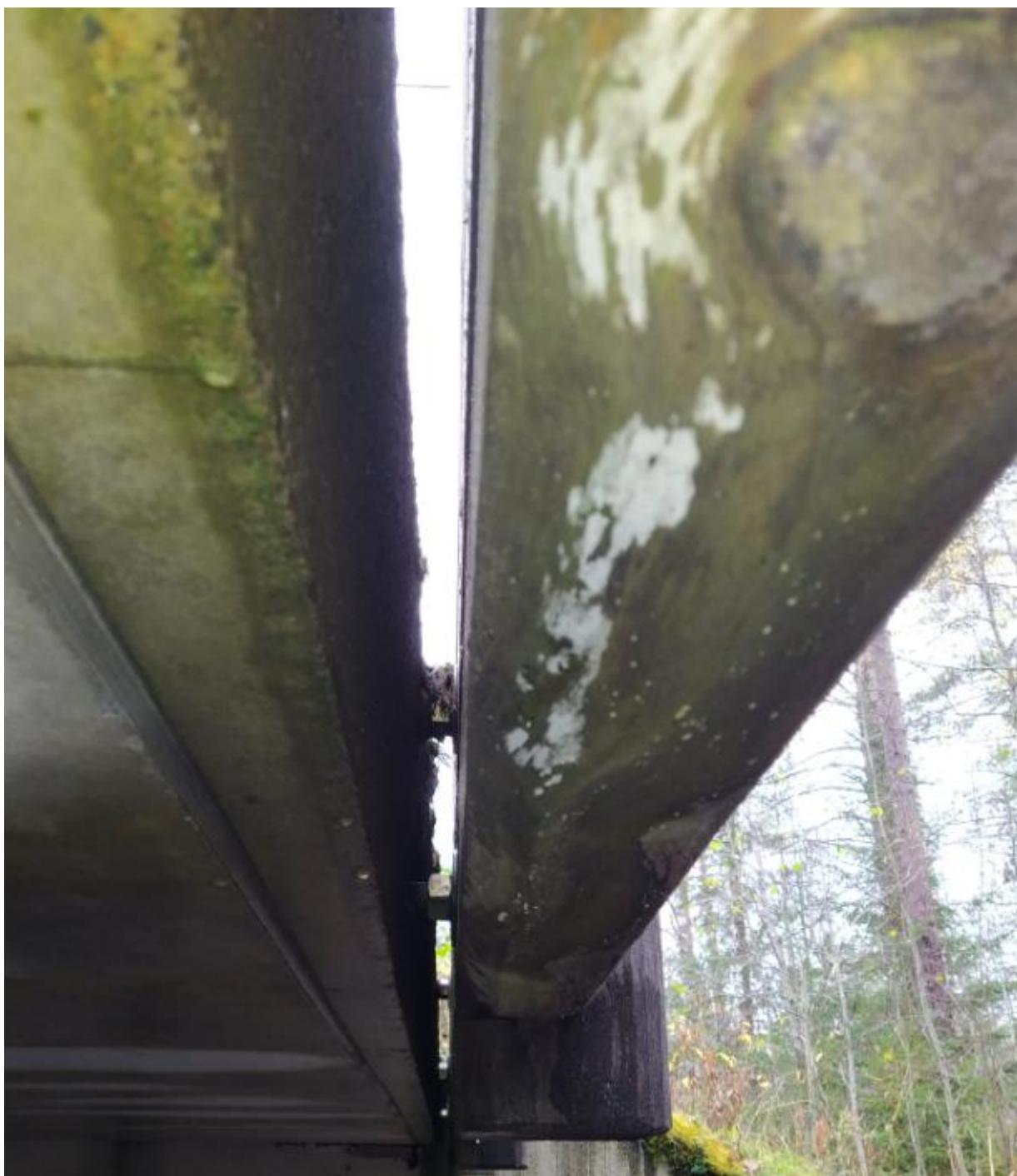
Kuva 8. Kaiteiden kiinnitys kansielementtiin