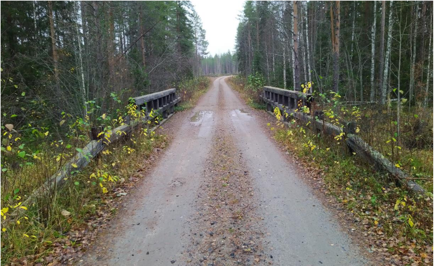
Kuva 3. Yleiskuva sillan ja penkereen kaiteista