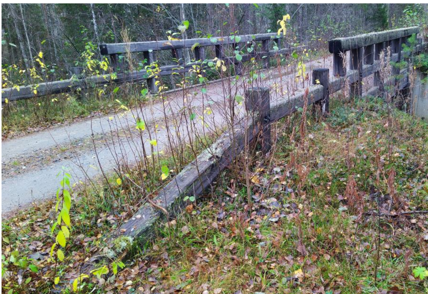
Kuva 8. Pengerkaide